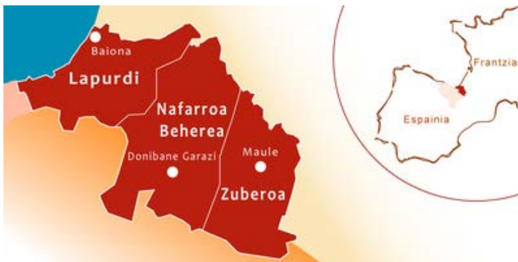
Mapa 1. Provincias del País Vasco norte.

Así, los años 2005-2011 se caracterizan por la fortaleza de la dinámica territorial proveniente tanto de la sociedad civil organizada (Urteaga 2008a) como de la clase política local. Además de la movilización de los Demo-Democracia para el País Vasco (Ahedo 2004), el auge de la plataforma Batera (2019a) y la creación de la Cámara de Agricultura del País Vasco norte, una mayoría de alcaldes de Iparralde se posiciona a favor de la organización de un referendo sobre la creación de un Departamento 3 específico. Esto se compagina con el alto-el-fuego de la organización armada y el inicio de un proceso de negociación entre el Estado español y ETA sobre las consecuencias del conflicto (desarme, presos, desmilitarización, etc.), por una parte, y entre los principales partidos políticos de la Comunidad Autónoma Vasca sobre el futuro político de ese territorio, por otra parte (Murua 2010, 2015); proceso que concluye con el fracaso de las conversaciones (Urteaga 2023b). Esta dinámica territorial está igualmente encarnada por la nueva política lingüística impulsada por los poderes públicos agrupados en el seno de la Oficina Pública de la Lengua Vasca (OPLB en francés) a la que se asocia un Comité Consultivo que reúne a las principales asociaciones lingüísticas (Urteaga 2019), y la aprobación de un Contrato Territorial País Vasco (Urteaga 2020b), en un contexto marcado por la reforma de las administraciones territoriales llevada a cabo en diciembre de 2010 (Vie Publique 2010).