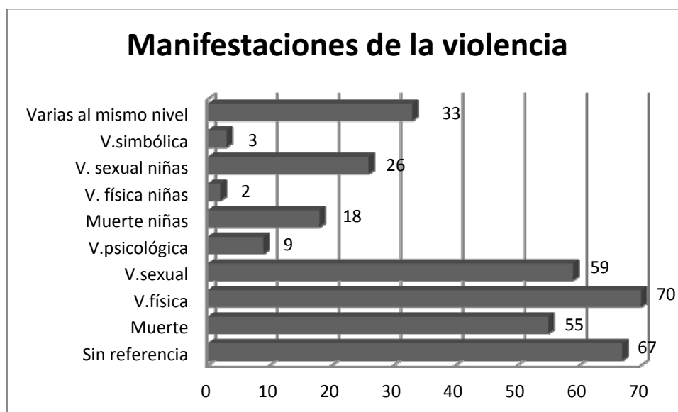
Figura 1. Manifestaciones de violencia recogidas en El País y El Mundo en los años 2000, 2004, 2008 15 .