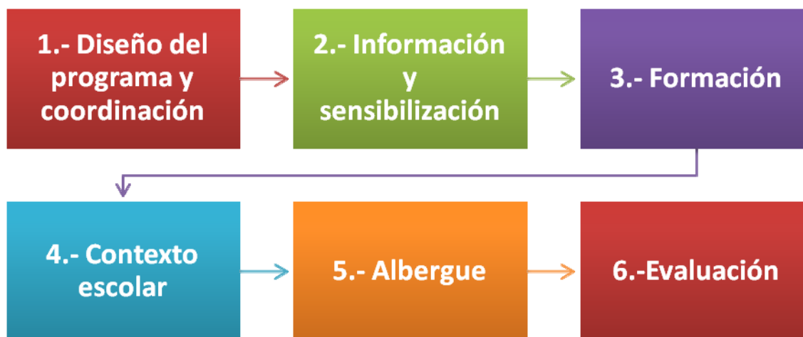
Gráfico 2: Fases del programa Bakeaz blai