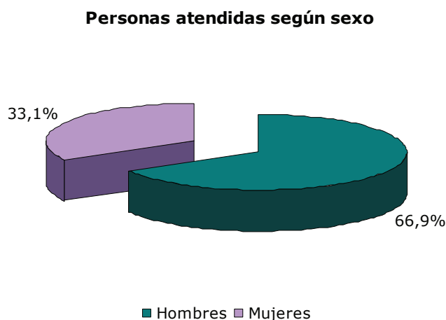
Gráfica 1 Participación según sexo en las intervenciones de Ai Laket!!

Las diferencias de participación se pueden desglosar en los diferentes proyectos que se han llevado a cabo, y así podemos destacar como existen claras diferencias entre unos y otros: